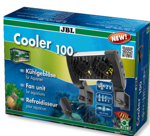
JBL Cooler 100 Chladicí ventilátory pro sladkovodní i mořská akvária