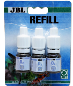
JBL O2 Sauerstoff Test New Formula

Schnelltest zur Bestimmung des Sauerstoffgehalts