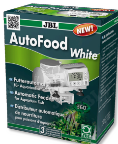
JBL AutoFood WHITE Alimentatore automatico bianco per i pesci d'acquario