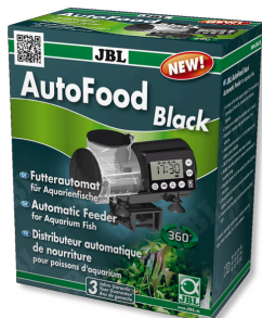
JBL AutoFood BLACK Alimentatore automatico nero per i pesci d'acquario