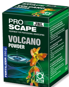
JBL PROSCAPE VOLCANO POLVERE Integratore substrato per acquari con piante