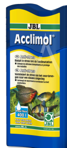
JBL Acclimol Preparazione dell'acqua per un nuovo ambientamento