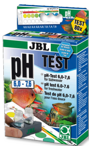
JBL Test pH 6,0-7,6 Test pH per acquari d'acqua dolce, ambito di 6,0-7,6