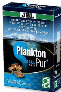
JBL PlanktonPur SMALL Lekkernijen voor kleine aquariumvissen