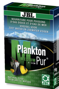
JBL PlanktonPur MEDIUM Lekkernij voor grote aquariumvissen