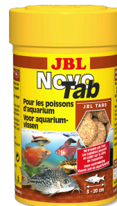
JBL NovoTab Primaire voedingstablet voor alle aquariumvissen