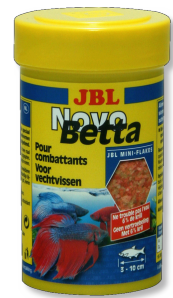
JBL NovoBetta Primair voer voor labyrinthvissen, bijv. kempvissen