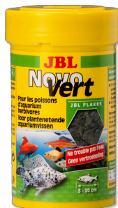
JBL NovoVert Primair vlokvoer voor plantenetende aquariumvissen