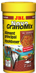
JBL NovoGranoMix Primair voer voor middelgrote en grote aquariumvissen