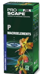
JBL PROSCAPE P MACROELEMENTS Plantenmest met fosfor voor aquascaping