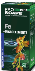
JBL PROSCAPE Fe + MICROELEMENTS Basis plantenmest voor aquascaping