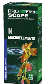
JBL PROSCAPE N MACROELEMENTS Plantenmest met stikstof voor aquascaping