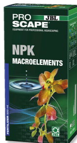
JBL PROSCAPE NPK MACROELEMENTS 3 componenten plantenmest voor aquascaping