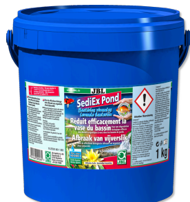
JBL SediEx Pond Bacteriën en actieve zuurstof voor de afbraak van slib