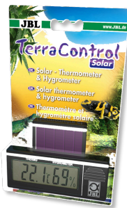
JBL TerraControl Solar Termometr solarny i higrometr do wszystkich terrariów