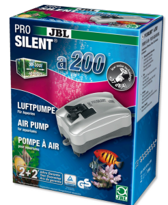
JBL PROSILENT a200 Bomba de ar para aquários de água doce e salgada