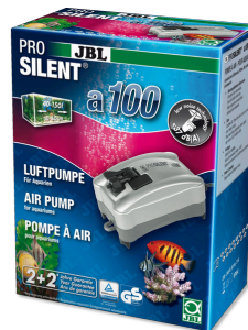
JBL PROSILENT a100 Bomba de ar para aquários de água doce e salgada