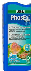
JBL PhosEx rapid Eliminador de fosfato para aquários de água doce