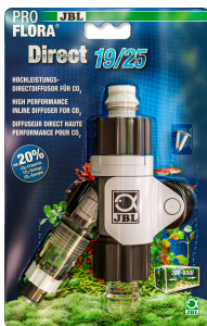
JBL PROFLORA Direct Difusor direto de alta eficiência para CO 2