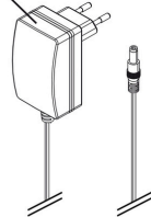
JBL ProTemp Cooler x200/x300 Fonte de alimentação