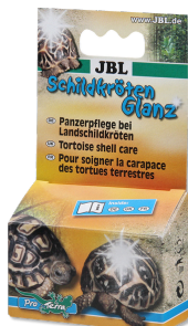
JBL Средство для ухода за панцирем у черепах

Препарат для ухода за панцирем сухопутных черепах