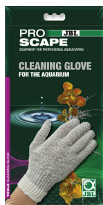
JBL ProScape Cleaning Glove Перчатка для чистки аквариума