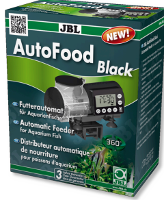
JBL AutoFood BLACK Akvaryum balıkları için siyah yem otomati