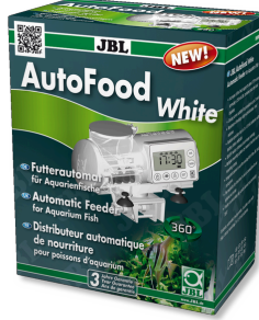
JBL AutoFood WHITE Akvaryum balıkları için beyaz yem otomati