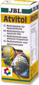
JBL Atvitol Akvaryum balıkları için multi vitamin damlaları