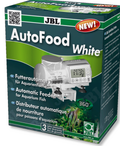
JBL AutoFood WHITE Akvaryum balıkları için beyaz yem otomatı