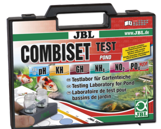
JBL Test Combi Set Pond

Bahçe havuzları için en önemli su testleri