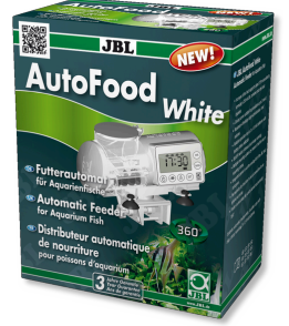
JBL AutoFood WHITE Akvaryum balıkları için beyaz yem otomatı