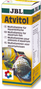
JBL Atvitol Akvaryum balıkları için multi vitamin damlaları