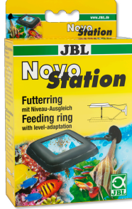
JBL NovoStation Su seviyesi dengeleyici ile birlikte yüzer yem halkası