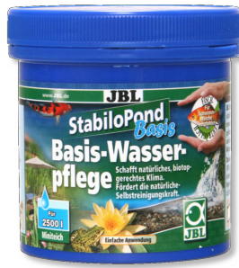
JBL StabiloPond basis

Havuzun kendini temizlemesini sağlayan bakteriler