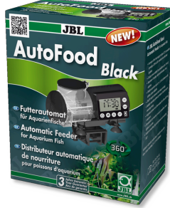
JBL AutoFood BLACK Akvaryum balıkları için siyah yem otomatı