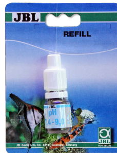
JBL pH 7,4-9,0 testi T. su akv. ve havuzl. için 7,4-9,0 aralığında pH testi