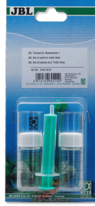
Su testleri için JBL parça seti