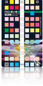
JBL PROSCAN ColorCard