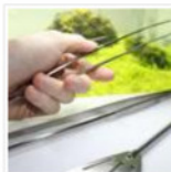
Produkttest: JBL AquaTerra Tools

Diese Artikel könnten Dich auch interessieren: