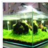
Produktvorstellung: Aquael-LED Light