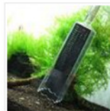
Produkttest: JBL Aqua Ex 10-35 (Mulmsauger für Nanoaquarien)