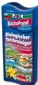
JBL BactoPond Bakterien zur Selbstreinigung vom Teich