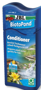
JBL BiotoPond Wasseraufbereiter für Teiche