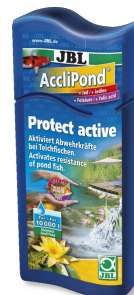
JBL AccliPond Wasseraufbereiter für Teich