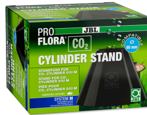
JBL PROFLORA CO2 CYLINDER STAND Pied pour bouteilles de 500 g de CO2