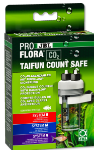
JBL PROFLORA CO2 TAIFUN COUNT SAFE Compte-bulles de CO2 avec clapet antiretour intégré