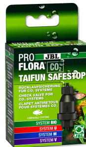
JBL PROFLORA CO2 TAIFUN SAFESTOP Clapet antiretour d'eau pour systèmes CO2