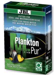
JBL PlanktonPur MEDIUM Büyük akvaryum balıkları için atıştırma