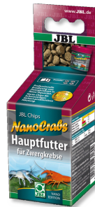
JBL NanoCrabs Cüce kerevitler için temel yem