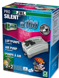
JBL PROSILENT a100 Vzduchové čerpadlo pro sladkovodní i mořská akvária