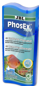
JBL PhosEx rapid Odstraňovač fosfátů pro sladkovodní akvária