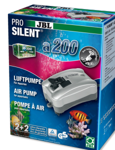
JBL PROSILENT a200 Vzduchové čerpadlo pro sladkovodní i mořská akvária