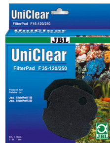
JBL FilterPad F35 Fijn schuimstof voor CristalProfi aquariumfilters