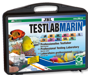
JBL Testlab Marin Coffret professionnel d'analyse de l'eau de mer