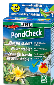
JBL PondCheck Rychlý test pro stanovení hodnoty pH a KH