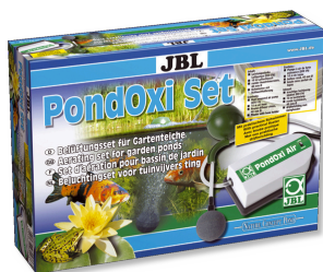
JBL PondOxi-Set Provzdušňovací sada s čerpadlem pro jezírka