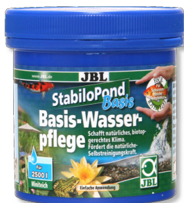
JBL StabiloPond Basis Základní přípravek do vody v zahradním jezírku