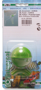
JBL Floater + AntiKink PondOxi Set için kıvrım önleyici donanımlı şamandıra