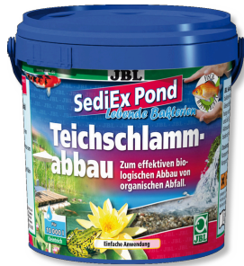
JBL SediEx Pond Çamurun bozunumu için bozund. bakt. ve aktif oksijen