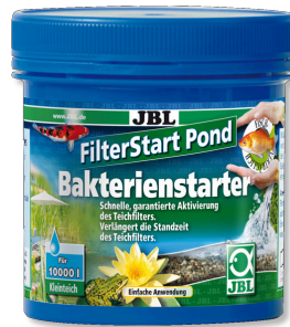
JBL FilterStart Pond Havuz filtresi için bakteri başlatıcı