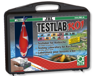
JBL Testlab Koi Koi ve bahçe havuzu için profesyonel test çantası