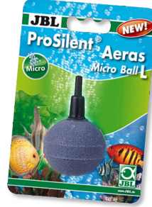
JBL ProSilent Aeras Micro Ball L Küçük hava kabarcıkları için hava taşı