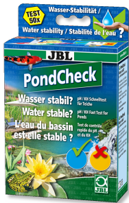
JBL PondCheck pH ve KS değerini belirlemek için hızlı test