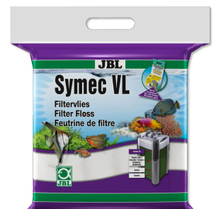
JBL Symec VL Vello d'ovatta contro tutti gli intorbidamenti