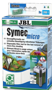
JBL Symec micro Microvlies voor aquariumfilters tegen vertroebelingen