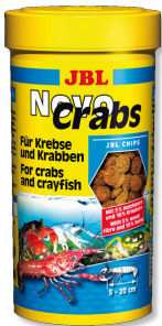
JBL NovoCrabs Yengeçler için cips şeklinde temel yem