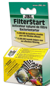
JBL FilterStart Bactéries pour activation des filtres