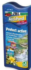
JBL AccliPond Prostředek k úpravě vody v jezírku