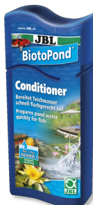
JBL BiotoPond Přípravek na úpravu vody v jezírku