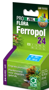
JBL PROFLORA Ferropol 24 Dagelijkse bemesting voor zoetwateraquaria