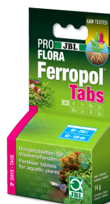
JBL PROFLORA Ferropol Tabs

Codzienny nawóz do roślin do akwariów słodkowodnych