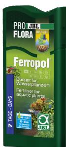
JBL PROFLORA Ferropol

Nawóz do roślin do akwariów słodkowodnych