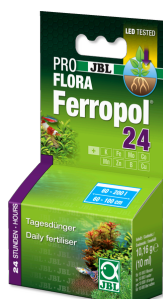
JBL PROFLORA Ferropol 24

Nawóz do roślin do akwariów słodkowodnych