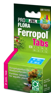
JBL PROFLORA Ferropol Tabs

Codzienny nawóz do roślin do akwariów słodkowodnych