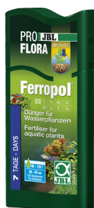
JBL PROFLORA Ferropol

Nawóz do roślin do akwariów słodkowodnych