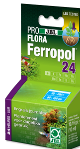
JBL PROFLORA Ferropol 24 Dagelijkse bemesting voor zoetwateraquaria