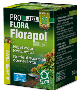
JBL PROFLORA Florapol Fertiliz. sustrato efecto prolong. acuarios agua dulce