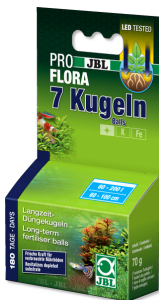
JBL PROFLORA 7 bolas Estimulador de raíces p. acuarios agua dulce (7 bolas)