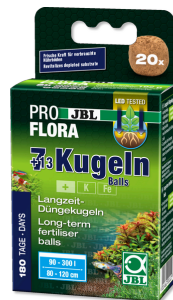
JBL PROFLORA 7 + 13 bolas Estimulador de raíces para acuarios de agua dulce