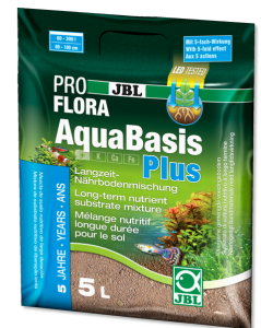
JBL PROFLORA AquaBasis plus Sustrato nutritivo duradero p. acuarios de agua dulce