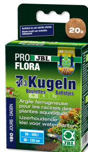
JBL PROFLORA 7 + 13 boulettes

Fertilisant racinaire, aquarium d'eau douce