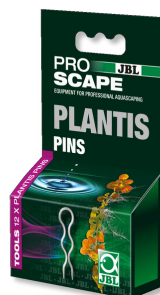
JBL PROSCAPE PLANTIS PINS Pflanzennadeln zur Fixierung von Aquarienpflanzen