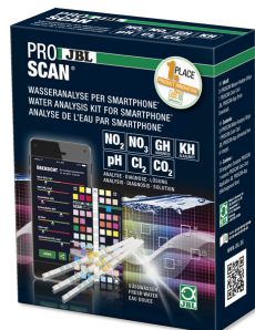
JBL PROSCAN Test de l'eau avec analyse sur smartphone