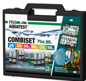
JBL PROAQUATEST COMBISET Plus NH 4 Coffret avec les principaux tests d'eau + test NH 4