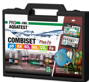
JBL PROAQUATEST COMBISET Plus Fe Coffret avec les principaux tests d'eau + test fer