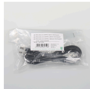
JBL PF CO2 CONTROL кабель для VALVE