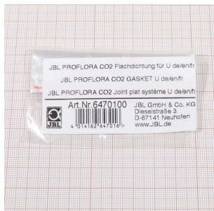
JBL PF CO2 плоское уплотнение для U