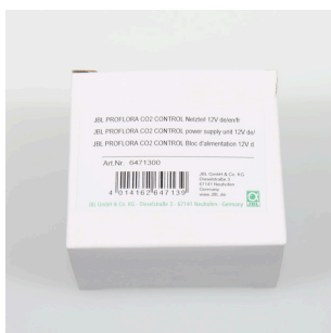
JBL PF CO2 CONTROL блок питания 12 В