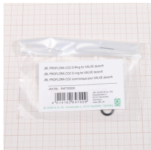
JBL PF CO2 уплотн. кольцо для VALVE