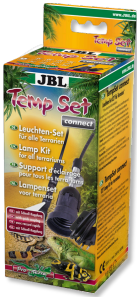
JBL TempSet connect Installationsset mit Steckverbindung