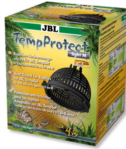
JBL TempProtect light Reptilien- Verbrennungsschutz für JBL TempSets