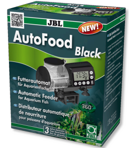
JBL AutoFood BLACK Zwarte voerautomat voor aquariumvissen