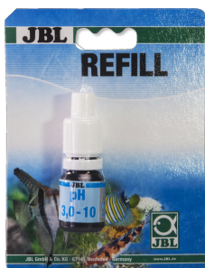
JBL pH 3,0-10,0 Test Schnelltest zur Bestimmung des Säuregehalts